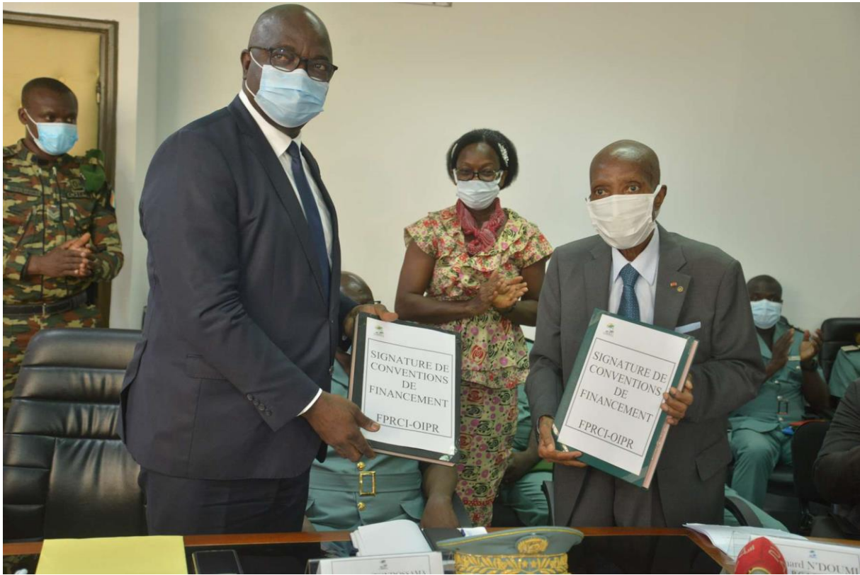
Cérémonie de signature de conventions de financement 2022 entre la FPRCI et l'OIPR