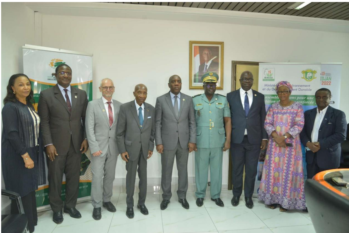
Photo de famille à la fin de la cérémonie de signature de conventions de financement 2022 entre la FPRCI et l'OIPR