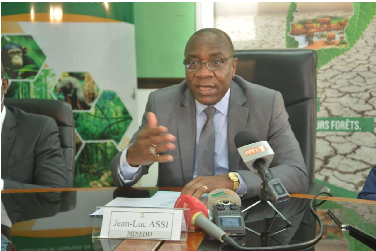
M. Le Ministre de l'Environnement et du Développement Durable lors de la Cérémonie de signature de conventions de financement 2022 entre la FPRCI et l'OIPR