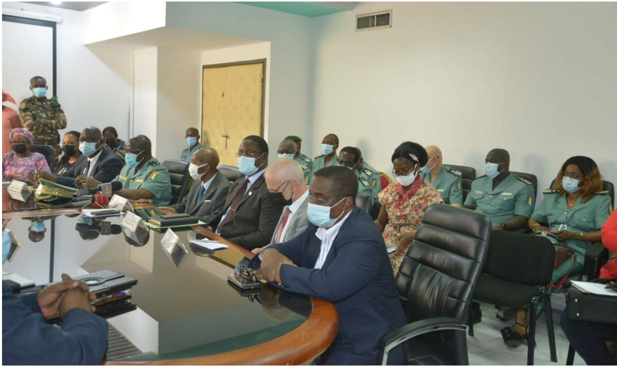
Table de séance lors de la Cérémonie de signature des conventions de financement 2022 entre la FPRCI et l'OIPR