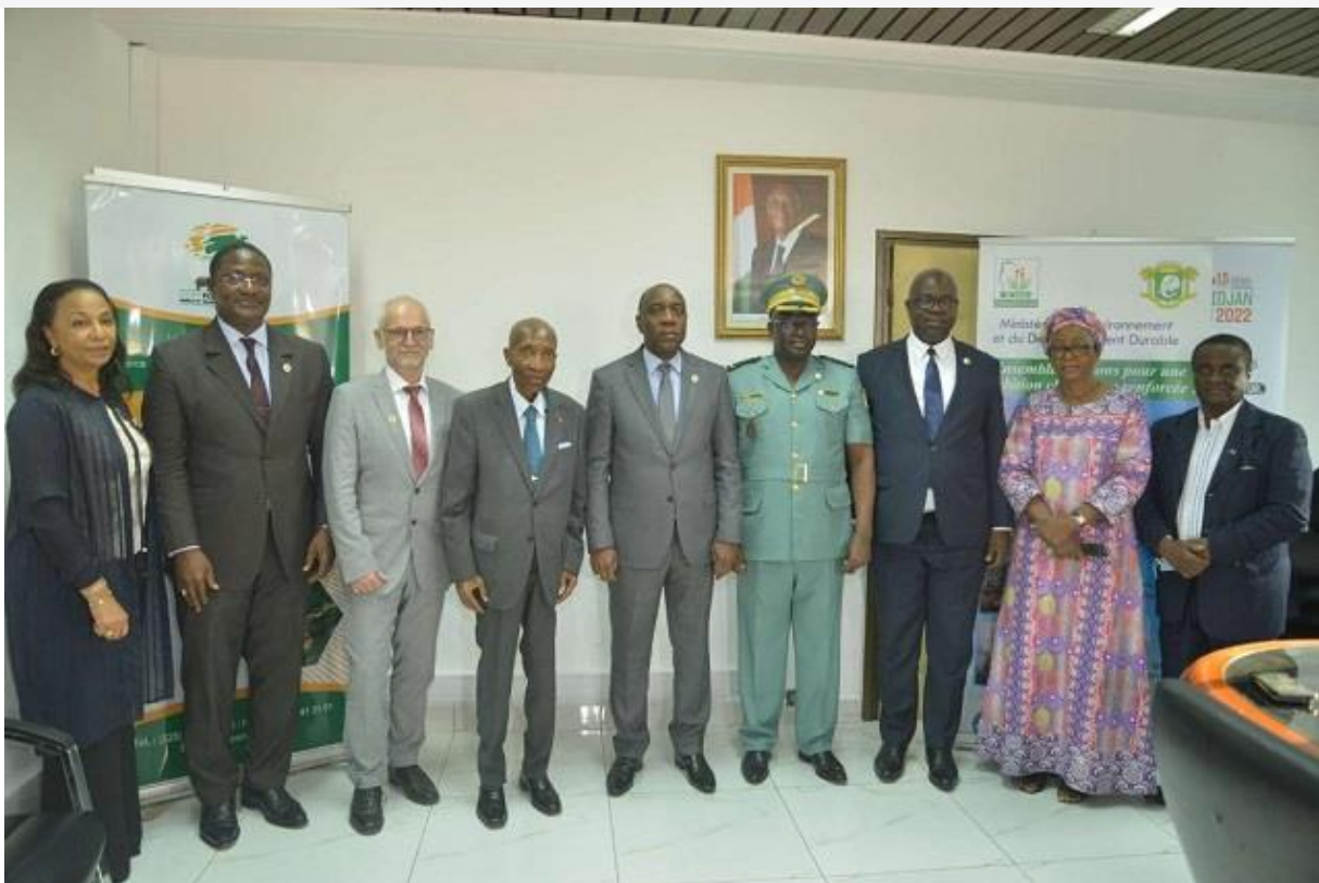
Une subvention de plus d'un milliard FCFA octroyé à l'OIPR par la FPRCI

IN: À LA UNE , ABIDJAN , DÉPÊCHES , ENVIRONNEMENT